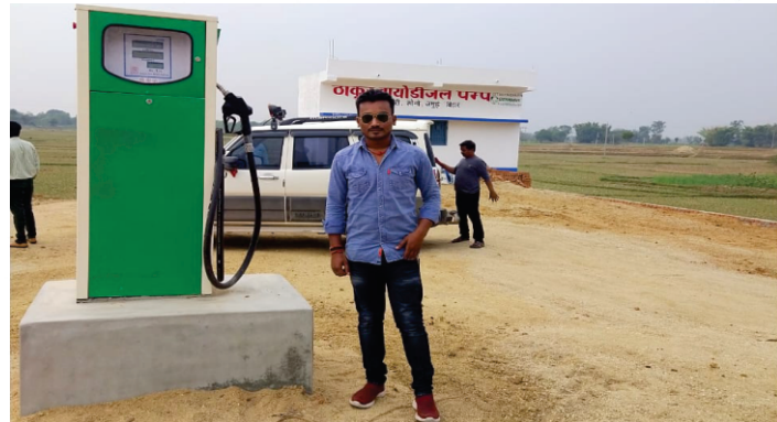
CONSTRUCTION STARTED PUMP